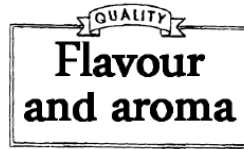
Trieda 30: Káva