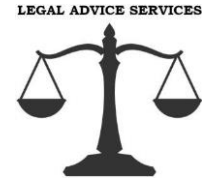
Trieda 45: Právne služby