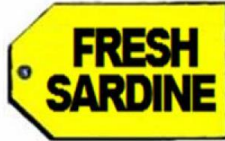
Trieda 29: Sardinky